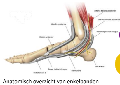
Anatomisch overzicht van enkelbanden