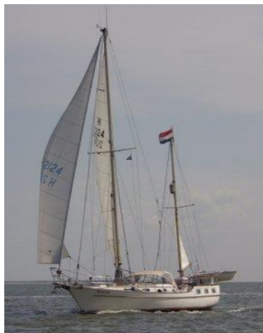
Zeiljacht Artruya, waar het zich afspeelde